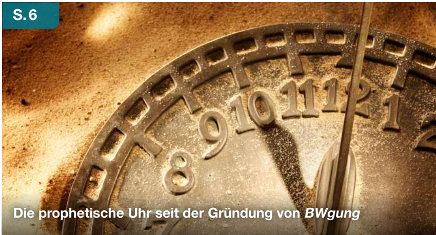
Die prophetische Uhr seit der Gründung von BWgung

Weltweite Adventgemeinde Nachrichten, die bewegen