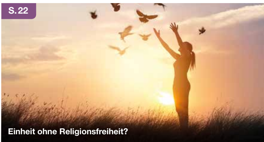
Einheit ohne Religionsfreiheit?